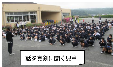
話を真剣に聞く児童

担当者より、「放送があったら動きを止めて最後まで話を聞く」「避難する時は、お押さない・は走らない（安全な場所まで）・しゃべらない・ももどらないを守る」の話がありました。