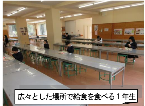
広々とした場所で給食を食べる1年生

※5・6年生は教室、1・2年生は1・2階ランチルームで、それぞれ分かれて給食を食べることになりました。