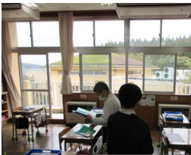
休み時間ごとに換気の徹底と放送による呼びかけ

※5・6年生は教室、1・2年生は1・2階ランチルームで、それぞれ分かれて給食を食べることになりました。