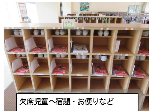
欠席児童へ宿題・お便りなど ポスティングによる学びの保障