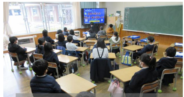
職員で作成した「正しい手洗いの仕方」を再確認