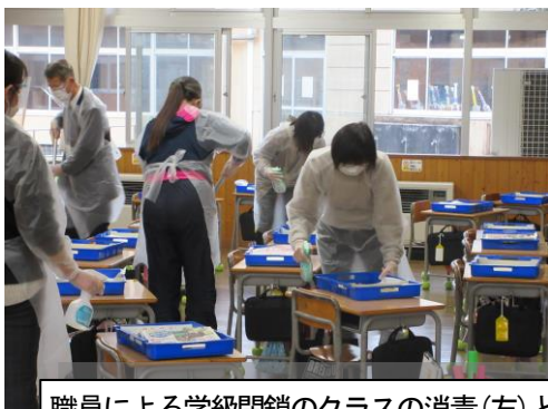
職員による学級閉鎖のクラスの消毒(左)とトイレの消毒作業(右)