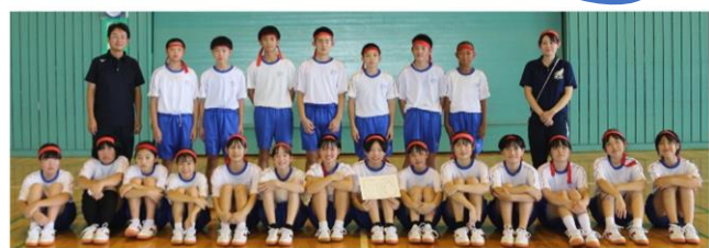
校内レクリエーション大会 からのワンショット

校内レクリエーション大会は、企画運営を生徒会が主体となって行いました。今年は、縦割り団対抗ではなく、学年問わず学級対抗で行ったので、全校生徒が楽しめる内容となるよう考え、工夫していました。当日は、生徒が主体的に行動したので、委員会担当の先生は見守るだけでスムーズな進行ができました。また中学校生活で、集団の中で、大きな声を発する経験がなかった生徒達ですが、徐々に盛り上がりを見せていました。保護者の皆様、暑い中でしたがご声援ありがとうございました。