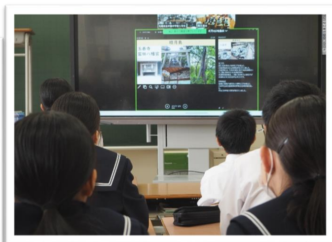
「神社はいくつあるのかなあ？」 質問もしましたが、やはり恥ずかしそうです。

本校からは、代表の生徒が中島町について紹介しました。残念ながら、このあたりでネット環境に不具合がでて、最後まで発表ができず、また、質問を受けることもできませんでした。