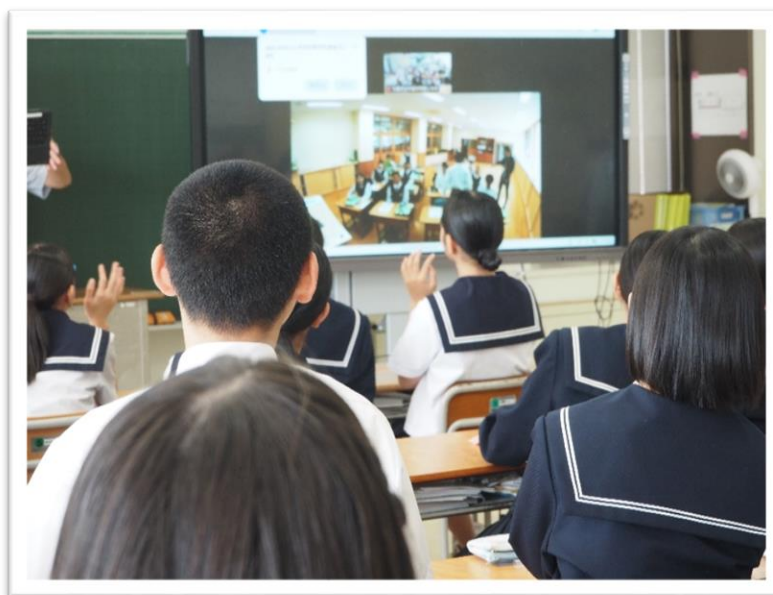
画面に愛媛県の中島中学校1年生の教室が映し出されると・・・思わず手を振るよね・・・