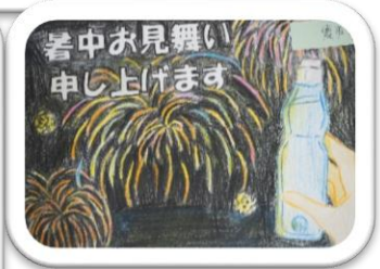
← ↑ 優秀賞

県大会出場の男女バスケットボールの壮行式を行いました。それぞれキャプテンからの抱負、そして生徒代表の激励の言葉がありました。