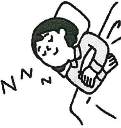
じゆうぶんな睡眠