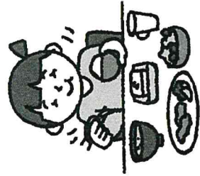
バランスのとれた食事

じゆうぶんな睡眠をとり、風邪に負けない体をつくるため、1・2年生 9じ 3・4年生 9時半 5・6年生 10時の早寝の時間を守りましょう。