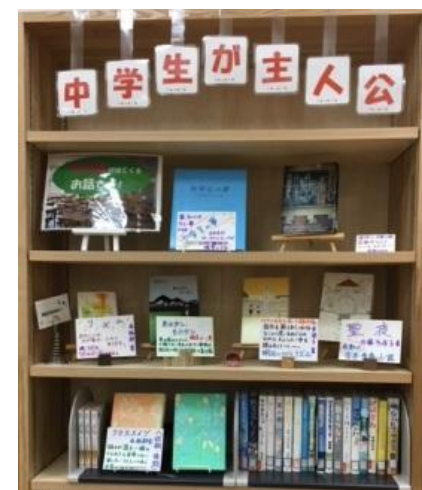
中学生が主人公の本です！