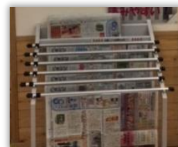
北國新聞が毎日届いています！