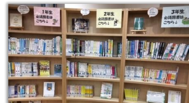
必読図書コーナー (国語の教科書に載っている本)