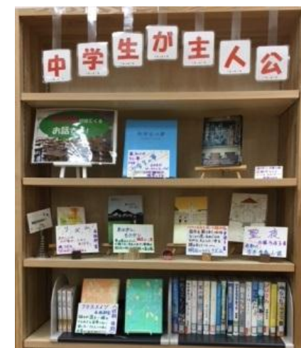
中学生が主人公の本です！