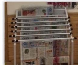
北國新聞が毎日届いています！