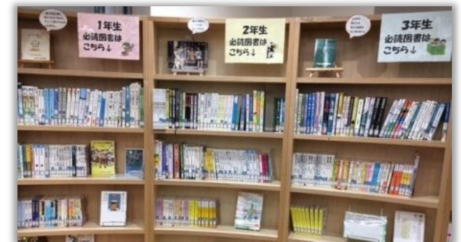
必読図書コーナー (国語の教科書に載っている本)