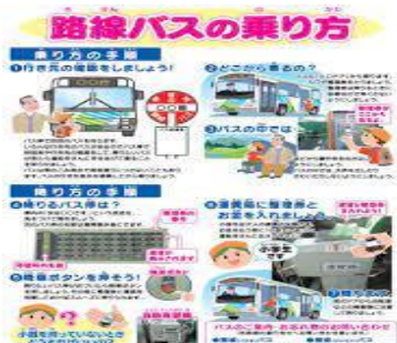
図 2 バスの乗り方を説明したチラシ