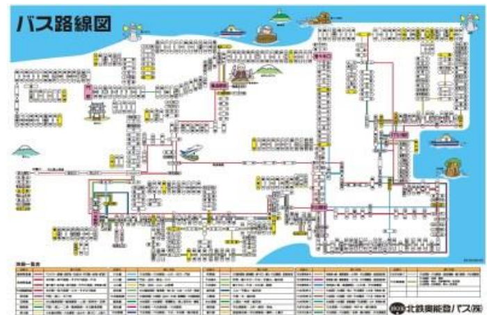
図 1 北鉄バスの路線図