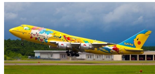
図3 ピカチュウジャンボ https://flyteam.jp/news/article/133108