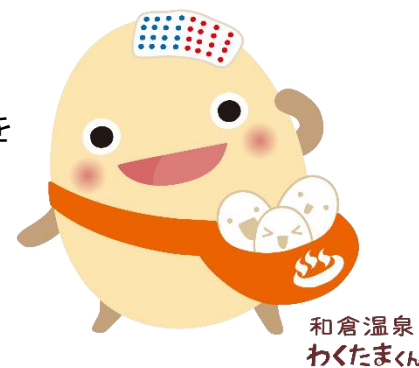
図2 和倉温泉のゆるキャラ「和倉温泉わくたまくん」