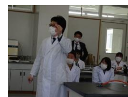
ガスバーナーの操作