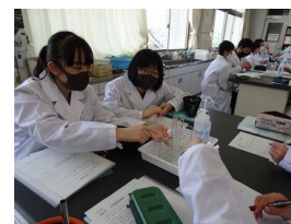
グループ内で話し合い