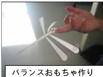
バランスおもちゃ作り