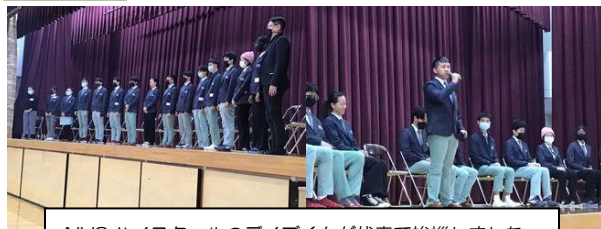
NUSハイスクールのテイクくんが代表で挨拶しました。