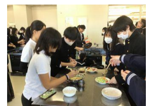
英語コミュニケーションII