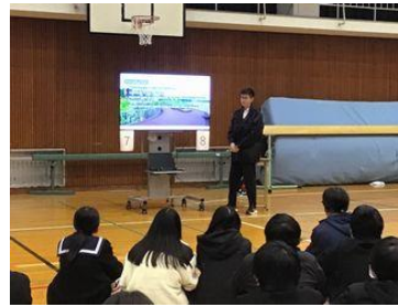
質疑応答まですべて英語で行いました。