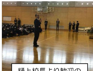
樋上校長より歓迎の言葉