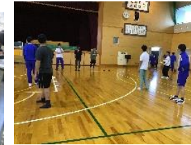
英語コミュニケーションI