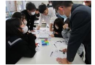
シティズンサイエンス