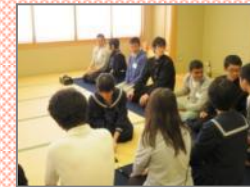
部活動参加：日本の伝統的な文化を体験しました。