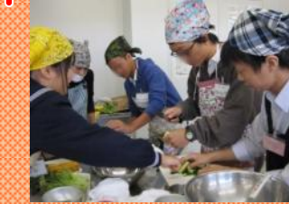
理数科1年生と手巻き寿司作り