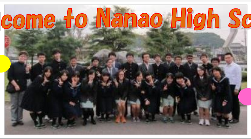
校門前で記念写真

10月31日(木)～11月4日(月)の間、本校理数科と交流のあるNUSハイスクール(シンガポール国立大学附属数理高校)の生徒11人と先生2人が研究交流のために本校を訪れました。