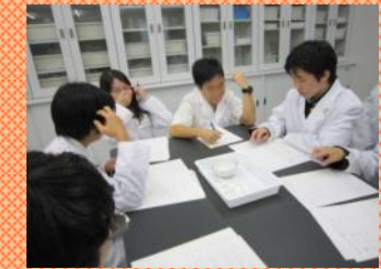
スペクトルの実験