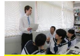
リサーチコミュニケーション