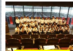
関西サイエンスツアー