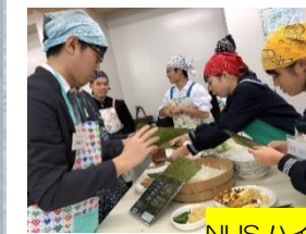
NUSハイスクール来校