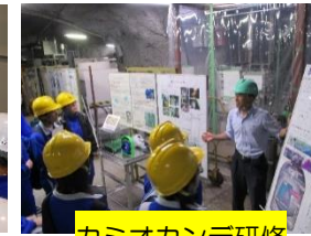
カミオカンデ研修