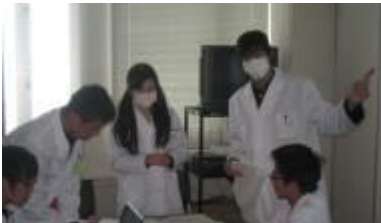
班ごとに課題を決めて取り組みました

まだ学習していない分野の内容も含まれ、高度な内容ではありましたが、生徒達はアルツハイマー病についてどのような研究がなされているか、また、仮説→実験→考察といった実証のシステムを学ぶたいへん貴重な経験をすることができ、医学への興味をかき立てられていたようです。