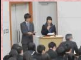
司会は文系フロンティアコース1年生が担当しました。