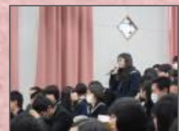
質疑応答も活発に行われました