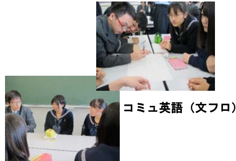
コミュ英語 (文フロ)