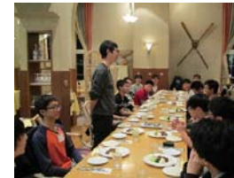
ウェルカムディナー