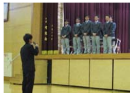
深浦生徒会長が生徒代表で歓迎の言葉