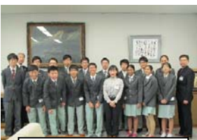
福島校長先生、番匠先生と記念撮影