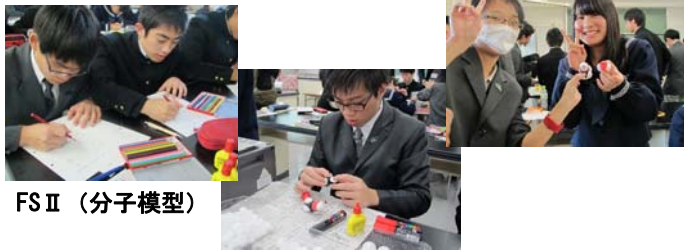
FS II (分子模型)