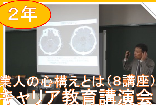
職業人の心構えとは(8講座) キャリア教育講演会