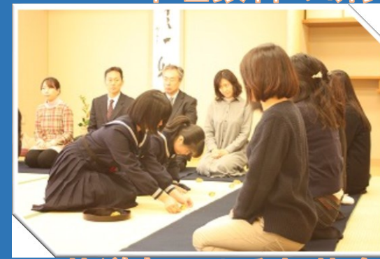
茶道部によるお茶会