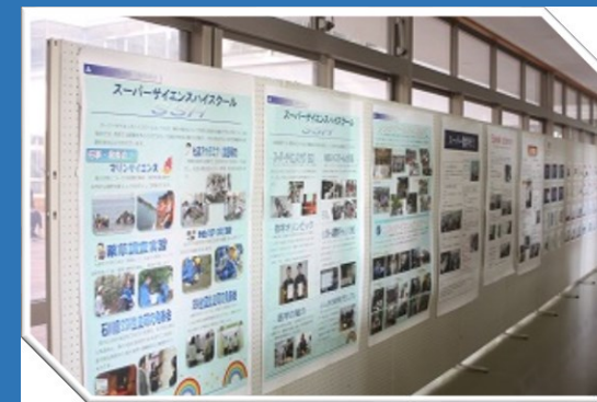
1年理数科の研究発表