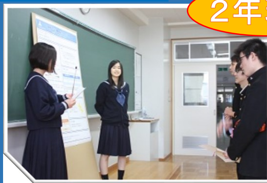
探究活動のポスターセッション