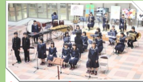
合唱部による合唱 吹奏楽局と図書委員による朗読

11月1日(火)から7日(月)にかけて学校公開が行われました。11月3日(木)には、本校の「特色ある取組」の公開があり、保護者の方や地域の方に本校の取組を見て頂きました。また、生徒たちも本校の取組を積極的に発信しました。