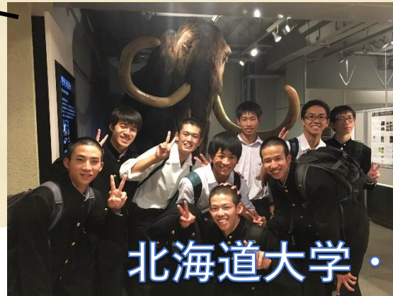
北海道大学・総合博物館見学