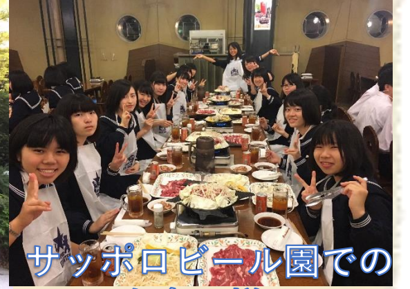
サッポロビール園での 夕食の様子