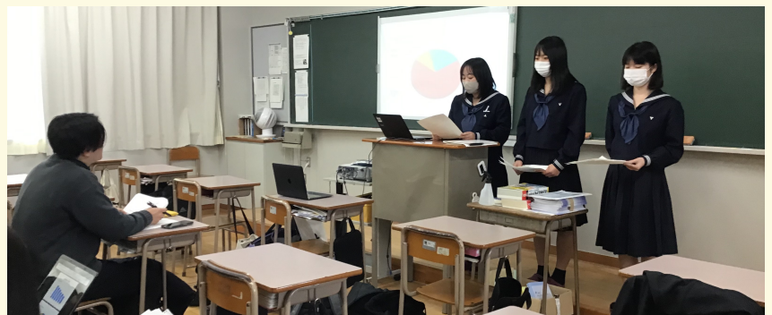
オンライン環境でICTを活用し、情報を共有しています。