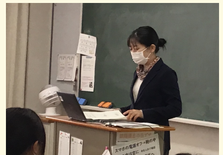
地元有識者の方にも、ご意見をいただきました。