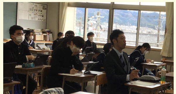
3学期は、貴重なご意見を基に課題解決方法を考えます！