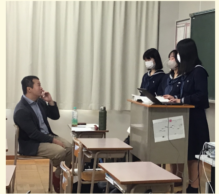
能登の課題とは何があるのかを考え、発表しています。