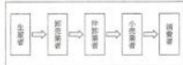
資料 ある野菜の流通経路

資料に示される流通経路によって、ある野菜を仕入れて販売していた小売業者が、この野菜を消費者に、より安い価格で販売するための流通経路の工夫として、□ということが考えられる。