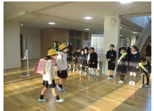
↑わんぱく班あいさつ運動の様子