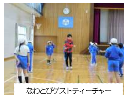
なわとびゲストティーチャー

主に体育の時間と長休みの時間に、健康と体力向上と冬場の運動量の確保のため、「なわとび運動」を行っています。短縄による運動、グループによる8の字とびが運動の中心となります。1月には、ゲストティーチャーをお招きし、技やコツを学びました。短縄では、自分のできる技に加え、挑戦したい技に何度も挑戦する姿が見られます。8の字とびでは、互いに声を掛け、悔しんだり喜んだりする姿が見られます。子供たちは、進取の心を育み、達成感を味わいながら寒さに負けずに取り組んでいます。