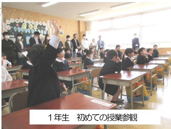
1年生 初めての授業参観