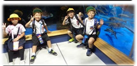
1・2年生が、「のとじま水族館」に行ってきました。海の生き物と触れ合って大満足です。