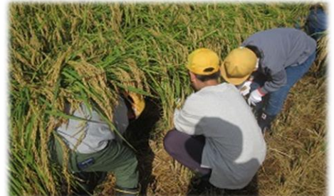
5年生が稲刈り体験をしました。稲刈りの大変さを味わい、お米のありがたみを感じることができました。