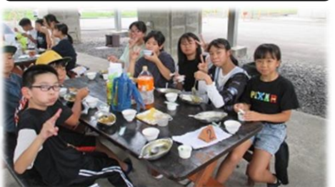
5年生が、「大杉みどりの里」(小松市)で宿泊体験学習をしました。岩魚つかみ、ウォークラリー、きもだめし、野外炊飯を体験し、自主・責任・協力の大切さを感じ、ひとまわり成長して帰ってきました。