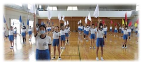
運動会に向けて、どの学年も頑張っています。練習がつからぬ日もあったかもしれませんが、それを乗り越えてこそその達成感・満足感が味わえるのです。行事を通して、心身ともに大きく成長してほしいと願っています。