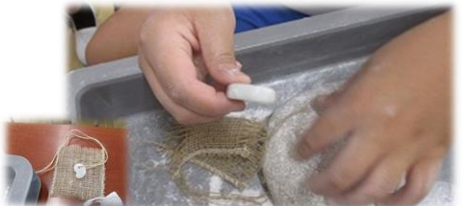
6年生が、土器焼きと勾玉作りに挑戦しました。古を感じることができたひとときでした。