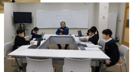
かほっくり・大崎スイカ・大根農家さん