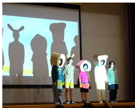
6年生を送る会の様子