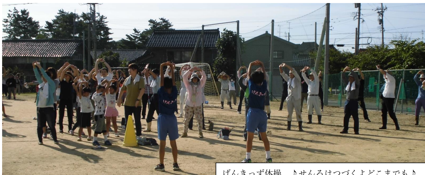
げんきっず体操 ♪せんろはつづくよどこまでも♪

そして、子ども達の健やかな成長とご家族の健康増進のために、ご家庭でも体操していただけると嬉しいです。