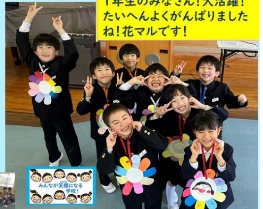
みんな笑顔になる学校!