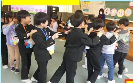
ジャンケン列車で楽しみました!みんな笑顔でしたね!