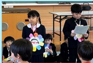
自分たちで会を進める1年生!