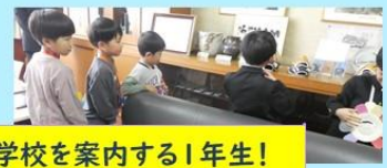
1年生のみなさん!大活躍!たいへんよくがんばりましたね!花マルです!