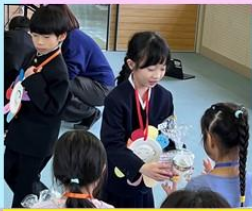
おみやげは、生活科で作った「まつぼっくりのけん玉」です!