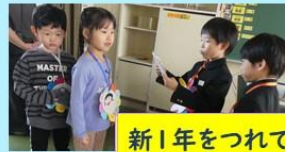
新1年をつれて学校を案内する1年生!