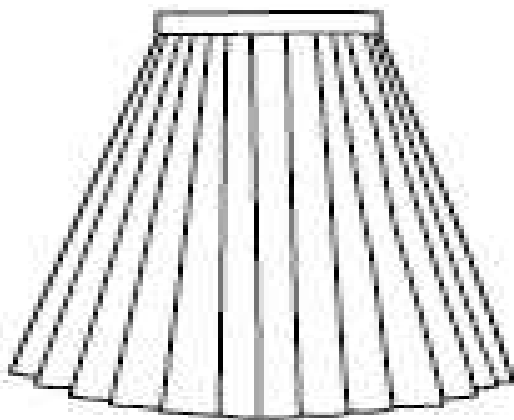
定番 24車縫スカート (冬生地・夏生地)