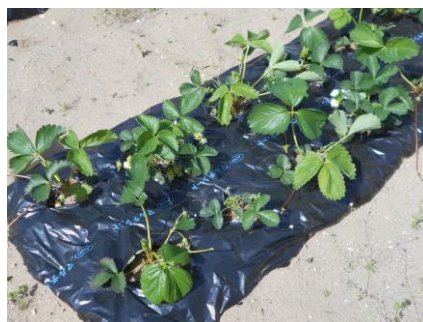
【イチゴの白い花が可愛いです！】

連絡アプリ「tetoru」のご登録をありがとうございました。今年度も、欠席・遅刻・早退の連絡は「tetoru」で受け付けます。電話での連絡は必要ありませんが、詳細等を伝えたい場合は、電話でも対応いたします。よろしくお願ひします。