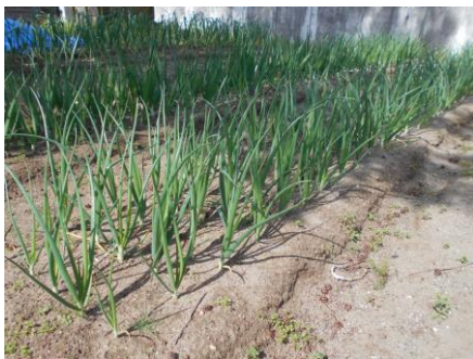
【土の中のタマネギ、どれだけ大きくなったかな？】