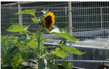
西小の中庭に咲くひまわり

1学期中は、毎日の学校やバス乗り場までの送迎も含め、様々な場面でたくさんのご協力とご支援をいただき、本当にありがとうございました。まだまだ復興途中の大変な状況に加え、暑さが心配な日々も多くなりそうです。保護者の皆様もくれぐれもお体に気をつけてお過ごしください。楽しい思い出がたくさんできる夏となりますように。