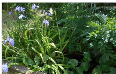
池の中には元気なメダカ！