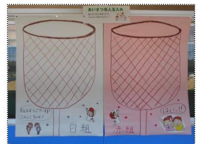
赤白対抗あいさつ名人玉入れ