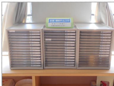
西荒屋小から持ってきた、学習チャレンジプリントや運動会の応援グッズと太鼓

2学期のスタートに当たり、ご家庭でも「早寝・早起き・朝ごはん」で生活リズムを整えるなど、ご支援とご協力をお願いいたします。お子様の様子で気になることがあれば、いつでもご連絡ください。2学期もよろしくをお願いいたします。