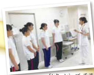
インターンシップ・看護