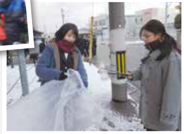
清掃ボランティア