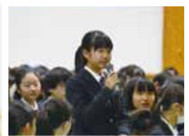
講演会・生徒質問