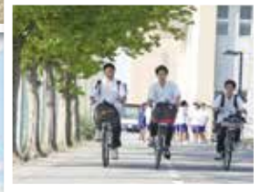
防災フィールドワーク