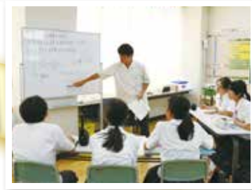
インターンシップ・教師