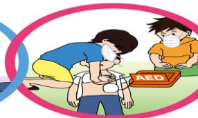
一次救命措置 心肺蘇生・AED