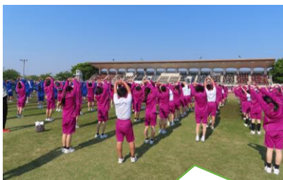
さわやかな朝！まずは錦丘体操！

4月30日(水)に金沢市営陸上競技場にて第7回校内スポーツフェスティバルが開催されました。今年度も体力測定だけでなく、大玉送りや台風の目、玉入れ、部活動対抗リレーなど、さまざまな競技が行われました。どの計測にも競技にも全力で取り組んだみなさん、運営に携わった人たち、身も心も昨年度よりレベルアップしていましたね。