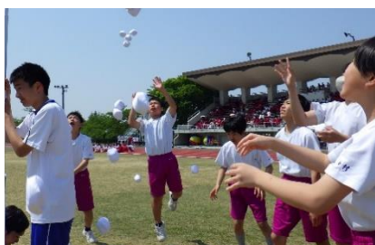
玉入れ「青空に向かって狙いを を定めます！」