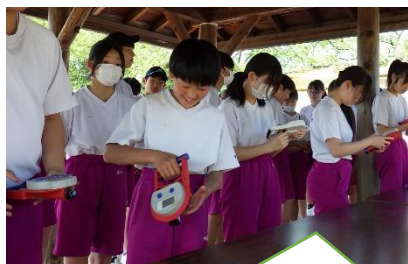
握力測定「めざせ！昨年度超え！」