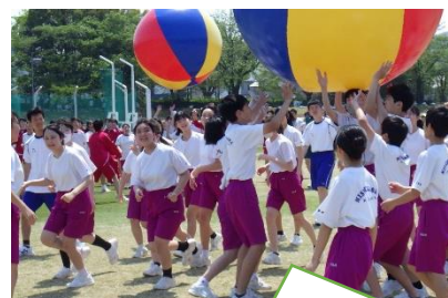
大玉送り「落とさないように…」