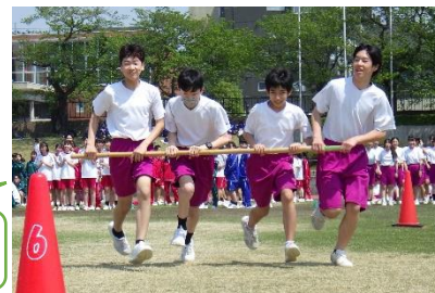
台風の目「協力して回転！」