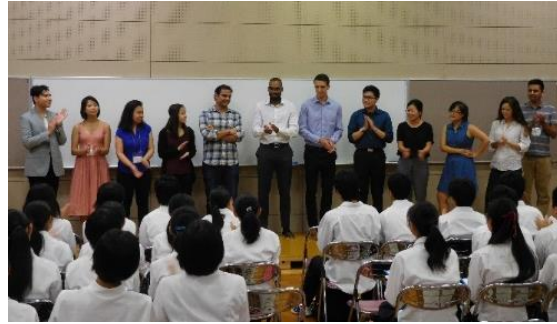
海外の大学生紹介・挨拶

1日目 プログラム初日は英語コミュニケーション力を高める活動を通して、ポジティブシンキングの重要性についてグループでディスカッションを行いました。海外からの学生と英語でコミュニケーションをとることに懸命で、生徒たちは緊張した面持ちでしたが、ポジティブシンキングについて一緒に考え、その重要性を実感していました。昼休憩時には、吹奏楽部が海外の学生たちを軽快な演奏で歓迎してくれました。