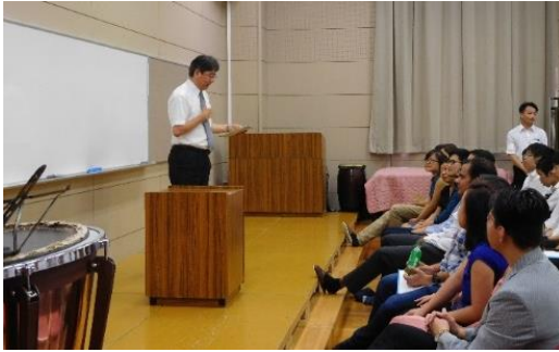
開講式にて(学校長によるスピーチ)

7月24日(月)から28日(金)までの五日間にわたり、エンパワーメントプログラムが本校にて開催されました。今年も60名の生徒が参加し、12名の海外の大学生・院生を迎えて、身近なテーマからより大規模なテーマにわたり英語でディスカッションをし、プレゼンテーションをしました。