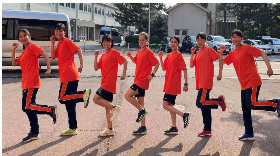
＜競技を終えた選手たち＞

さらに、石川県での開催ということで、1・2年生の多くは補助員としても参加しました。たくさんの協力を頂いて、無事に北信越大会を終えることができました。身近でレベルの高いレースを見て、刺激を受けたはずです。9月には新人大会、11月には県駅伝が控えています。高い目標とモチベーションを持って今後の練習に励むと共に、上位大会で勝負できる技術と精神力を養っていききたいと思います。応援ありがとうございました。