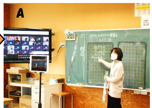
3年生の学年休業の時のオンラインの様子です。算数の学習がありました。