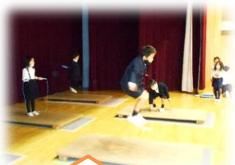
必死にジャンプ！どんな技に挑戦かな？