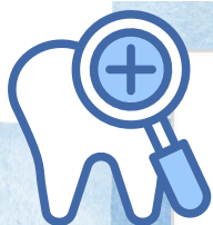
治療カードをもらった後 カードを学校へ出した人・出していない人(人数)