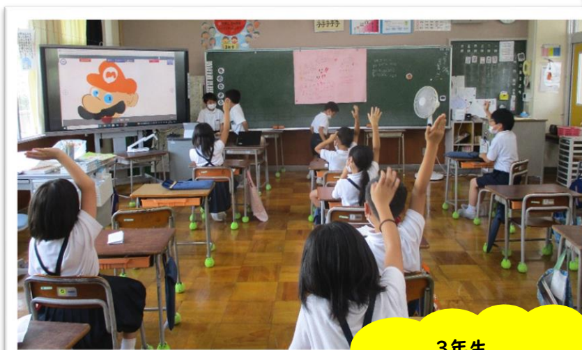
3年生 みんなで出し物 工夫して