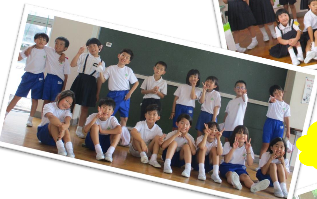
2年生 お別れお楽しみ会 みんなで仲良く!