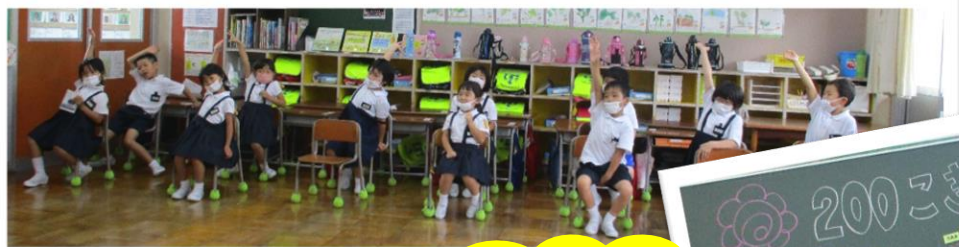
1年生 花丸 200 個記念 パーティー

【各学年 お楽しみ会】1学期の頑張りを振り返り、みんなで楽しい時間を過ごしました。