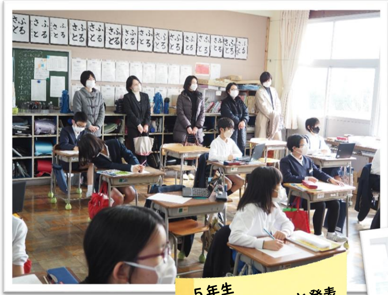
5年生 社会科 調べたこと発表