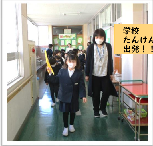
学校 たんけん 出発！！