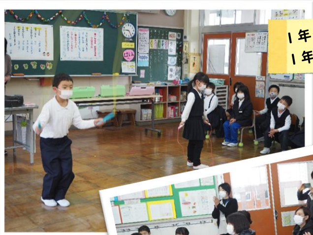
1年生 1年生を迎える会リハ