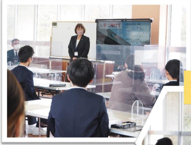
6年生 中学校説明会