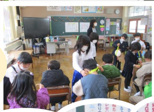
最後のあいさつも ばっちり！