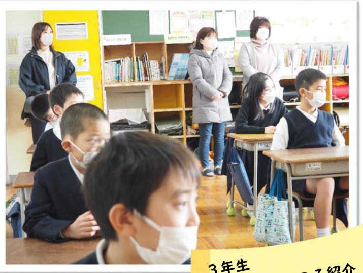
3年生 能登島のいいところ紹介