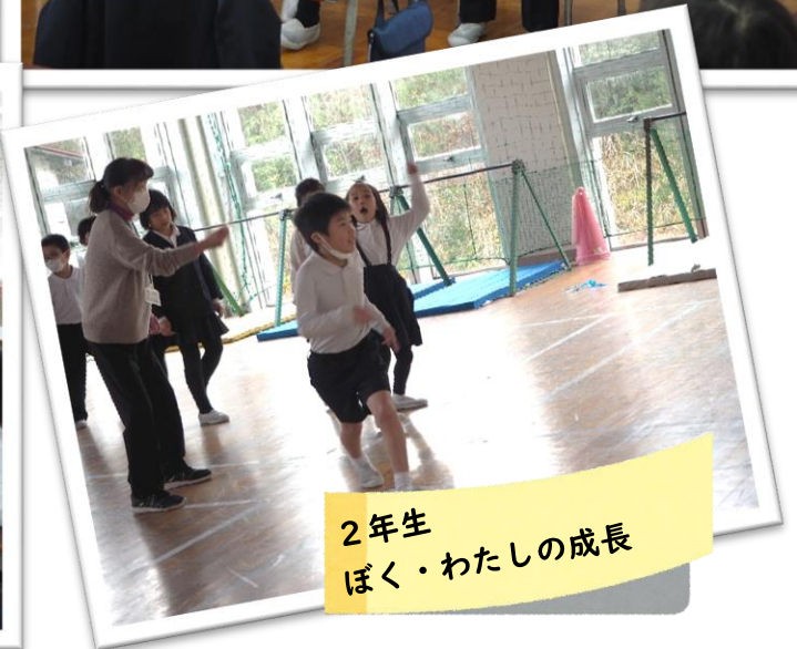
2年生 ぼく・わたしの成長