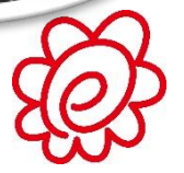
よくがんばったね！