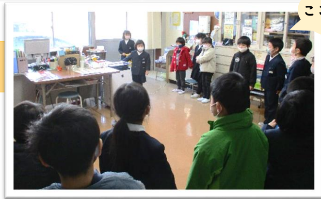
ここは保健室です