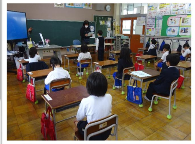
待っているお友だちも、大変良い姿勢でいすに座っています。 まるで、卒業式のようなですね。ステキ!!