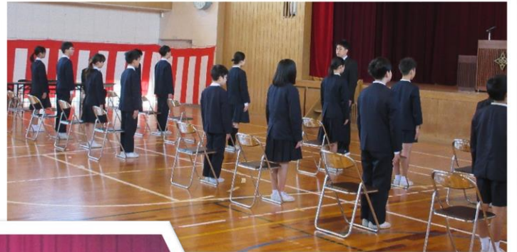
卒業記念品授与 卒業記念品目録贈呈