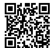
連絡メール2 保護者ログイン

* 保護者サイト https://renraku.education.ne.jp/parent/