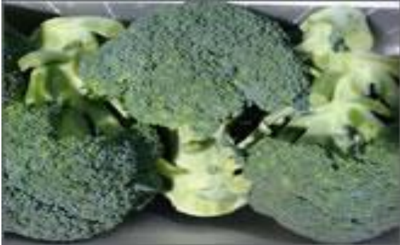
能登ブロッコリー