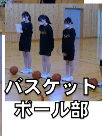
バスケット ボール部