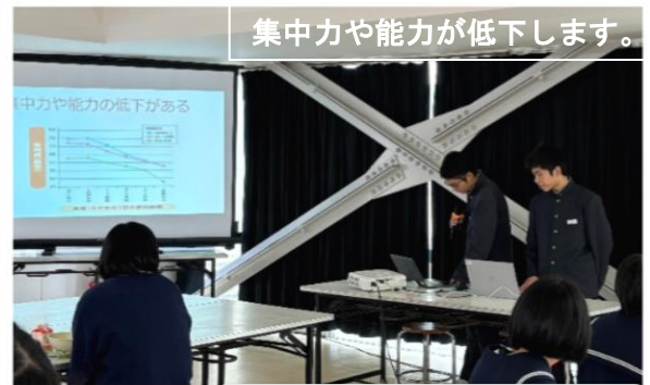
集中力や能力が低下します。

2学期も残りわずかとなり、あと10日ほどで冬休みに入ります。冬休みは、クリスマス、大晦日、お正月などがあり、生活リズムが乱れやすくなります。自分で自分の生活リズムを意識して、健康で元気な冬休みを過ごしてください。