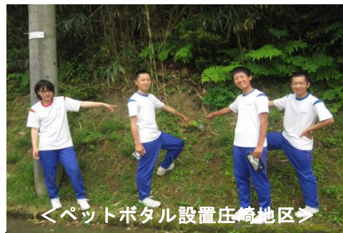
＜ペットポタル設置庄崎地区＞

「小木地区から一人も犠牲者を出さない」を合言葉に、今年度も中学校では防災活動に取り組んでみます。その一環として、5月18日には、校外生徒会単位で「ペットポタルの設置」、21日には「高瀬台地を駆けあがれ」が取り組まれました。7月20日には、こども園や小学校と連携した避難訓練、9月23日には第8回小木地区津波避難訓練が計画されています。中学校が防災活動の一翼を担い、活動に取り組んでいきましょう。