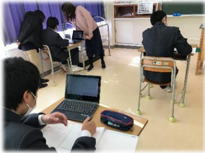
↑各自でレポート作成&音声入力 (3年生英語)

文部科学省が全国一律にICT環境の整備をすすめる事業のこと。具体的には1人1台端末及び高速大容量の通信ネットワークを一体的に整備すること。さらに、そのことにより、多様な子供たちを誰一人取り残すことのない、公正に個別最適化された学びを全国の学校現場で持続的に実現させること。 (文部科学省資料より作成)