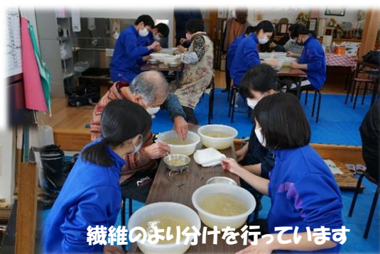
繊維のより分けを行っています