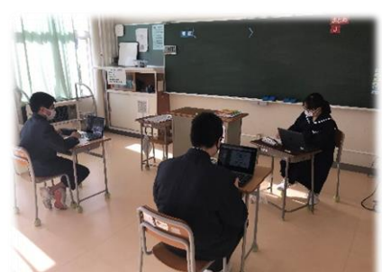
↑プレゼンソフトの利用 (生徒会活動)