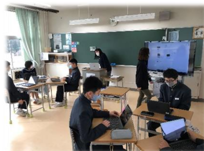
↑ニュース原稿・発表用スライドの作成 (1年生国語)