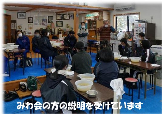
みわ会の方の説明を受けています