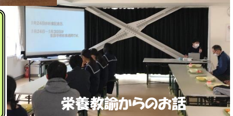
栄養教諭からのお話