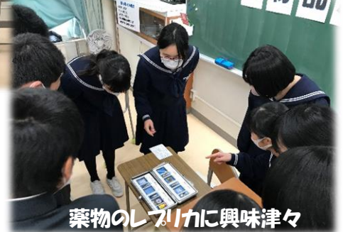
薬物のしつかりに興味津々