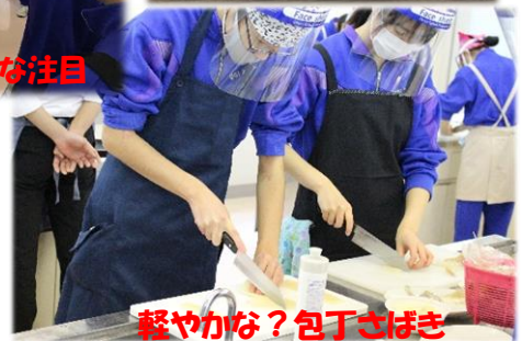
軽やかな？包丁さばき