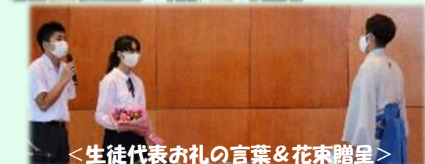
<生徒代表お礼の言葉&花束贈呈>