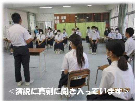
＜演説に真剣に聞き入っています＞