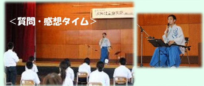
<質問・感想タイム>

体験談を聞いて印象に残った言葉は、「感動は人を変えることができる」です。日々の生活で感動を見つけ出し、実際にやってみることが大切だなあと感じました。そして、いじめは絶対にしてはいけないということも改めて感じました。体験談を語っていただき、自分の人生の勉強になったし、これから夢や目標を立てて努力していきたいと思いました。貴重な演奏、体験談を話していただき、本当にありがとうございました。