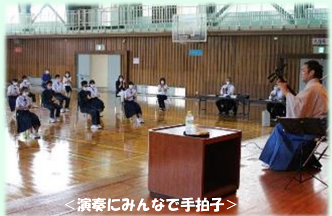
<演奏にみんなで手拍子>

三味線の演奏もとてもすてきでした。とてもかっこよかったです。日本の伝統楽器はとてもすごくて、初めて聞いたけど感動しました。